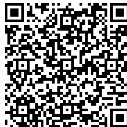
QR Formato de Denuncia

Recilogic cuenta con una sólida política contra actos de corrupción, hostigamiento laboral y sexual, así como cualquier práctica que atente contra los Derechos Humanos. Diseñamos un formato de denuncia en el cual, si alguna persona ha sido víctima o testigo de cualquiera de estos actos, en este formato se podrá comunicar experiencias a la Dirección General que gestionará la denuncia con la seriedad debida.